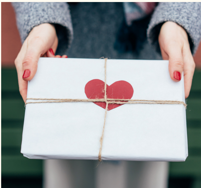
Daad bij het woord voegen.

Iemand vroeg me vorige week over deze vragen: maar hoe ziet die zachtheid er dan uit? Is het misschien liefde naar jezelf en naar de ander?