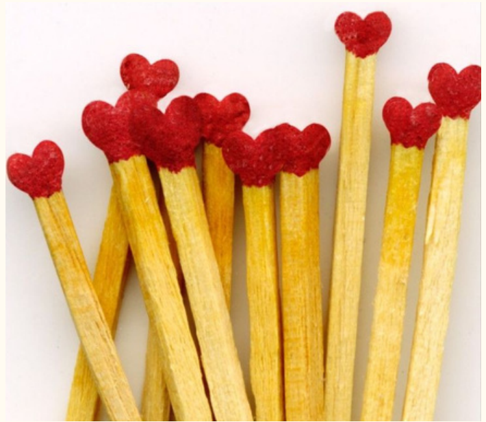
Impact van meer zachtheid.

En kijk nog eens naar de vragen waar ik vorige week over schreef. Over de reden waarom je deze zachte reis zou maken. Misschien heb je ze nog niet beantwoord? Dan is dit je moment.